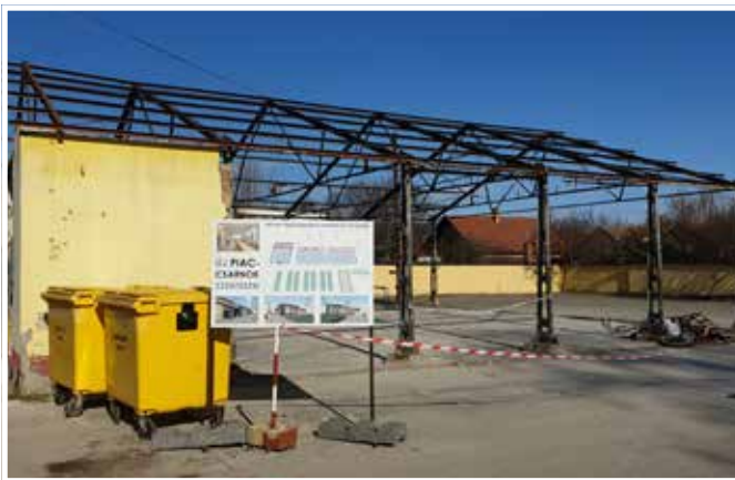
A vasszerkezetet is elbontották

amely szervesen kapcsolódik a csarnokhoz, illetve vizes blokk is létesül benne. Bízom abban, hogy a nyár folyamán el fognak készülni. A beruházást és a kivitelezést is szeretnénk úgy megvalósítani, hogy a piac a jelenlegi üzemelését semmilyen szinten ne akadályozza. Próbáljuk minimalizálni a munkaterület nagyságát. A piac egész évben folyamatosan, a hét több napján nyitva van, kiszolgálja a város lakosságát, segíti a helyi termelők piacra jutását, mely a város esetében különösen kiemelt jelentőséggel bír.