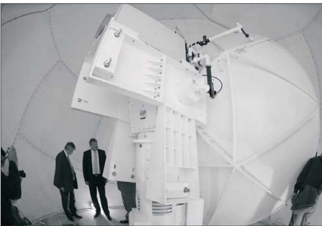
A radarberendezés 421 millió forintba került

dékmérés pontosabbá tételéhez egy-egy esőzés mértékének előrejelzéséhez. Az új radarállomás teljesen automatikus, a működése nem igényel emberi jelenlétet a rendszeres karbantartásokon kívül. A távfelügyeletet kamerákkal és riasztóberendezéssel biztosítják. Az állomás áll operatív szolgálatba és az adatait bárki láthatja majd a meteorológiai szolgálat honlapján. BG