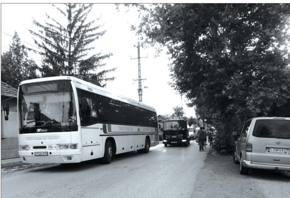
Kétmilliárd forintos biztonsági forrás van az elképzelt tervekre.

Az önkormányzat tulajdonában lévő lakások bérlétéről szóló önkormányzati rendelet módosítása megosztotta a képviselőket. Az elmúlt két évben három jelentős módosítás érte ezt a rendeletet. A mostani arra hivatott, hogy egységesítse mindezt. A legnagyobb problémát az jelenti, hogy nem áll rendelkezésre elegendő szociális bérlakás. A jelenlegi lakók a bérlési díját sem tudják fizetni, így merült fel a javaslat,