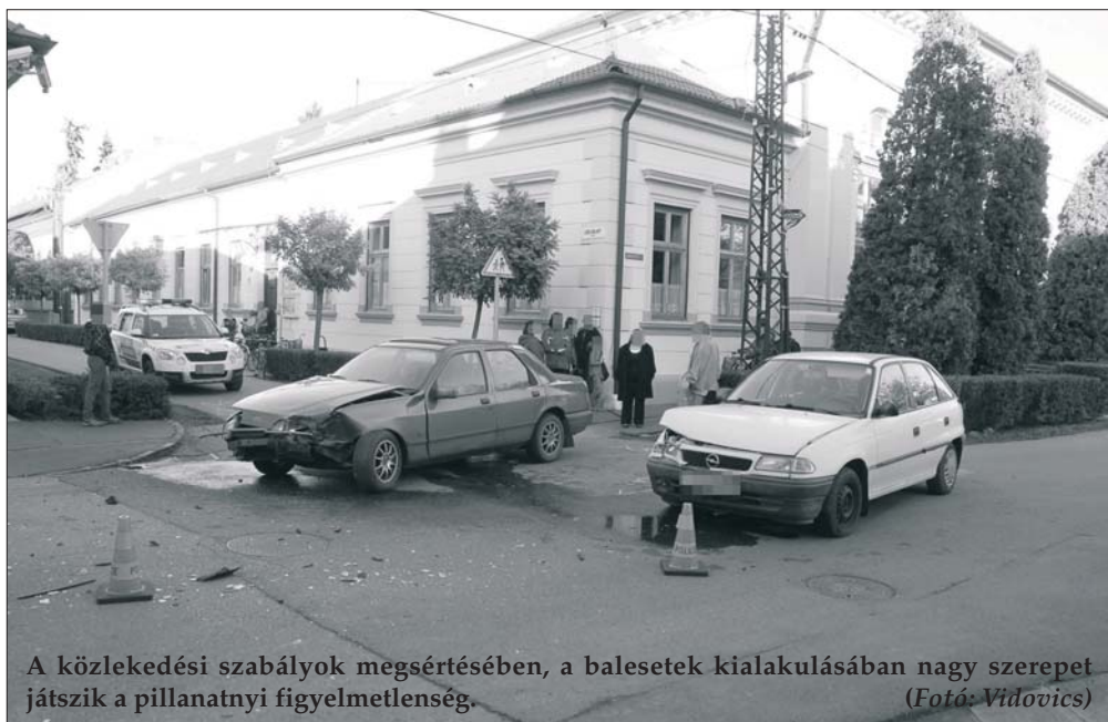
A közlekedési szabályok megsértésében, a balesetek kialakulásában nagy szerepet játszik a pillanatnyi figyelmetlenség.