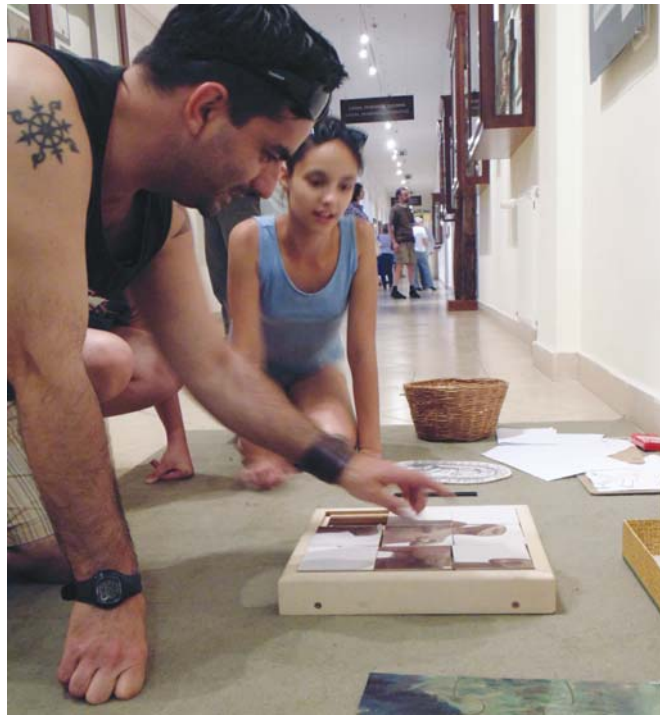
Sarlós isten-puzzle a múzeum folyosóján