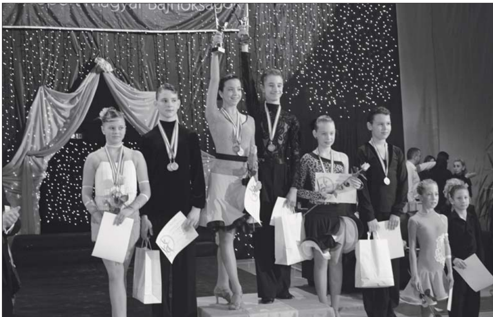
Küldetésük szerint, a „létezés legillékonyabb művészete” az, amit előadásukkal közvetítenek felénk.

megkezdésekor – mint a leg-több élsportban – szponzor felkutatását javasolják az oktatók, aki támogatni tudja a tanítványt előmenetelében.