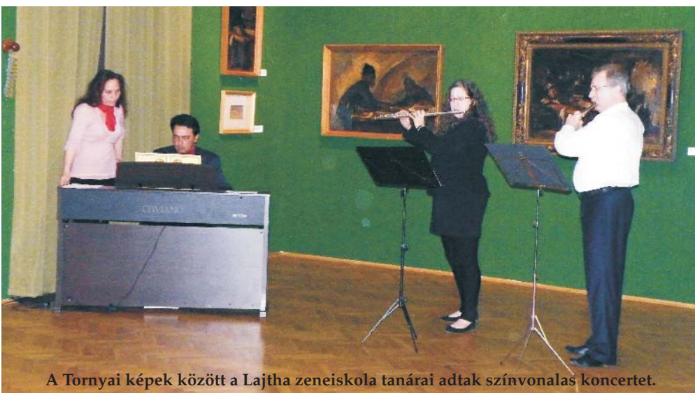
A Tornyai képek között a Lajtha zeneiskola tanárai adtak színvonalas koncertet.