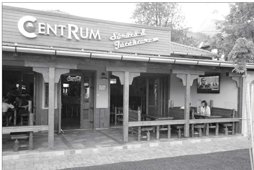
Nehéz olyan szabályt bevezetni, ami a lakosságnak, a szórakozóknak és a szórakozóhelyek tulajdonosainak is megfelel.