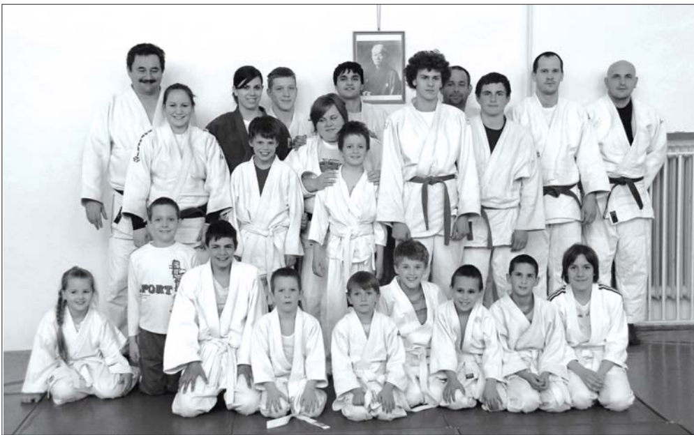
Tíz-tizenkét fő úzi versenyszerűen a judót a Pollák DSE keretein belül Szentesen.