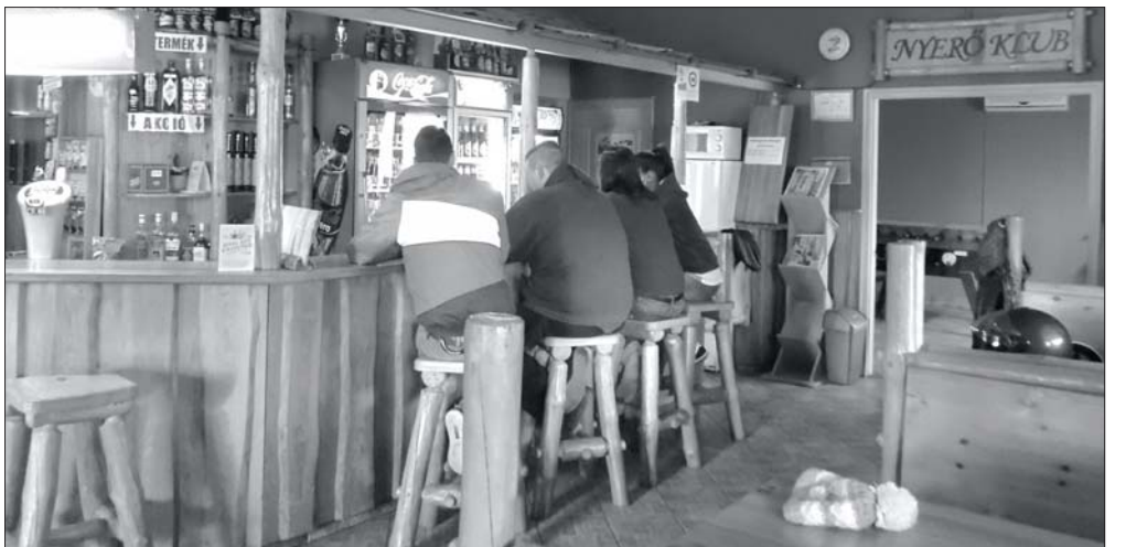
Nem a vendéglátóhelyekkel van probléma, hanem az emberek viselkedésével.