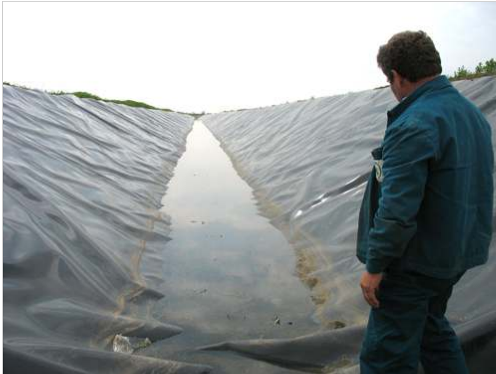
Ember és vad számára egyaránt veszélyes lehet a befóliázott öntözőcsatorna.