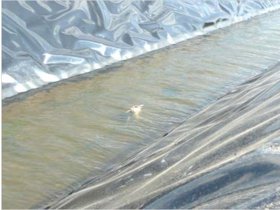
Több mezei nyúl is belepusztult már a csatornába. A szerző felvétele

Felhívtuk a területileg illetékes Körös-Maros Nemzeti Park igazgatóságát, ahol elismerték, egyre nagyobb veszélyt jelent a hazai vadállományra az árok befóliázása, de ez a fajta szigetelés teljesen jogszerű. Mivel védett állat is van a Szentesnél elpusztult vadak között, vadvédelmi bírság kiszabása várható, de hosszabb távon abban látják a megoldást, ha az ilyen árokbélelések előtt vadrámpák építésére köteleznék a beruházó szervezeteket. Kerestük az Alsó-Tisza Vidéki Környezetvédelmi, Természetvédelmi és Vízügyi Felügyelőséget, hátha meg tudják mondani, milyen következményei lehetnek ennek az esetnek, illetve mivel lehetne elejét venni az effajta vadpusztulásnak. A hivatal időt kért a válaszadásra.