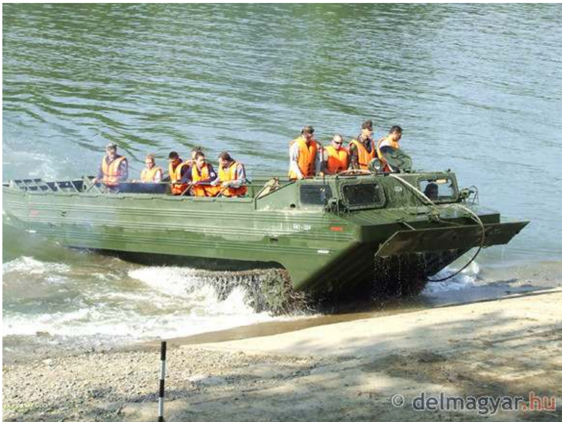
Árvízi katasztrófavédelmi gyakorlat Szentesen. (galéria)