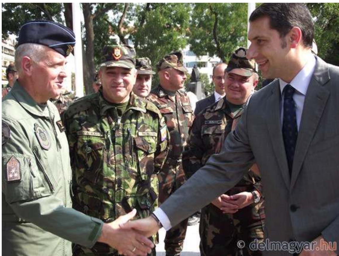
Katasztrófavédelmi zárőnnepség Vásárhelyen. (galéria)