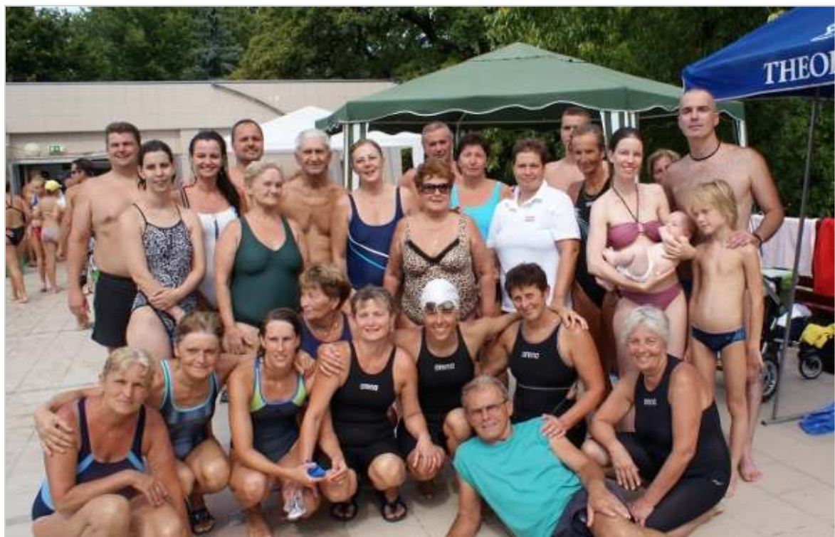
Együtt a nagy csapat. A szentesiek Gyulán is kitettek magukért.