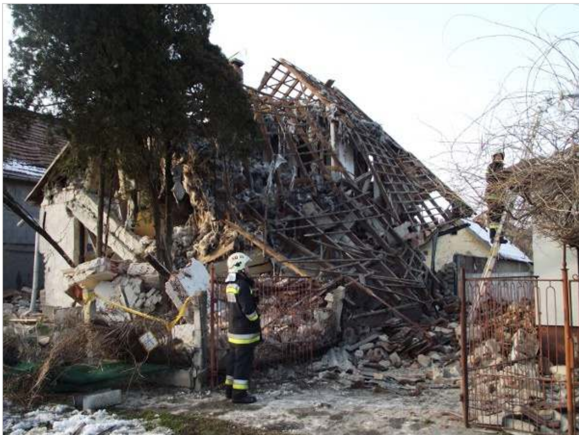
A gázrobbanás a szomszédos épületeket is megrongálta.

A romok alatt egy 61 éves nőt találtak, aki életveszélyes sérüléseket szenvedett.