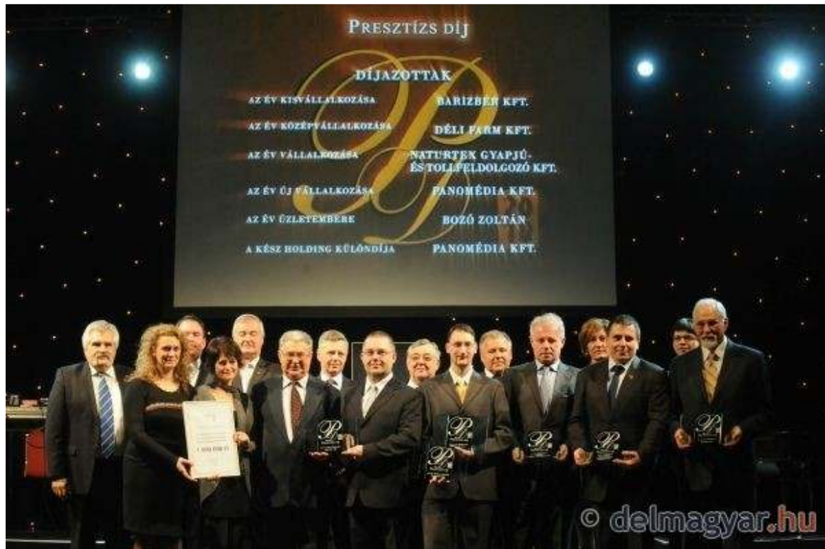
Presztízs gála a TIK-ben. Fotó: Frank Yvette és Schmidt Andrea (galéria)