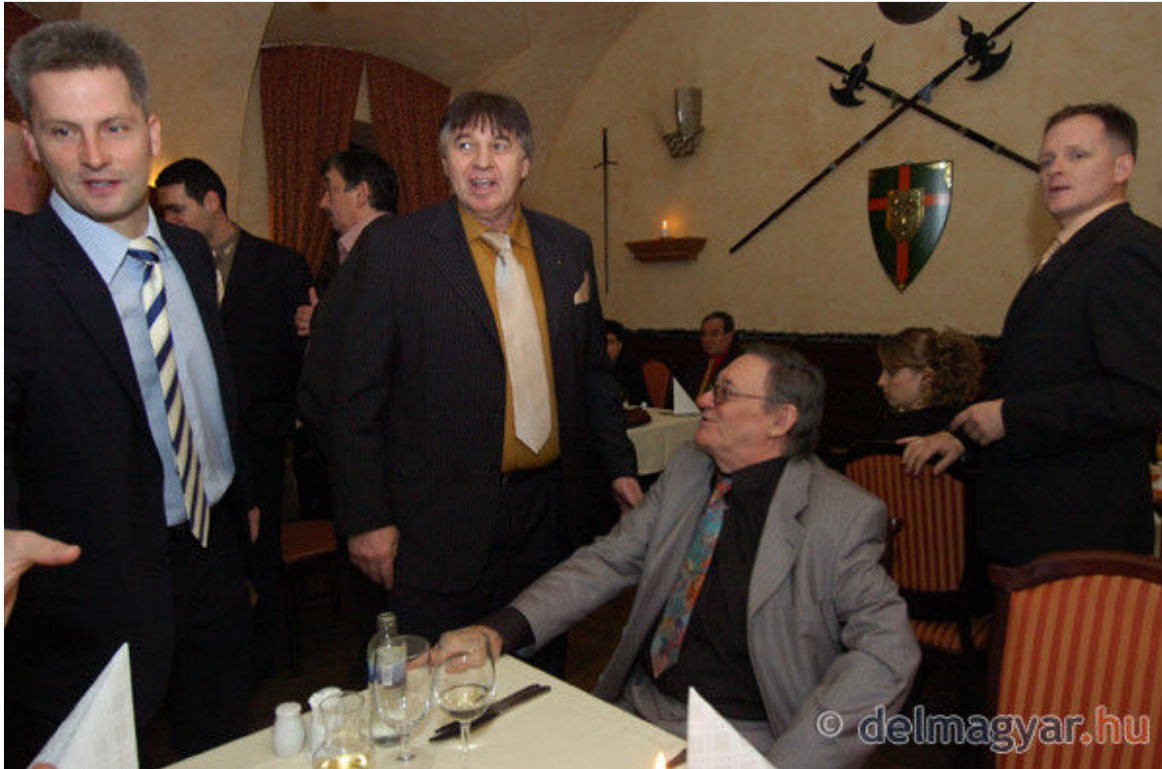
Átadtuk elismeréseinket Csongrád megye 2010-es legjobb sportolójának. (galéria)

18:00 Köszöntünk mindenkit a Délmagyarország és Délvilág Év sportolója díjátadó gáláról. A vendégek lassan érkeznek, hamarosan kezdődik az ünnepség. Kövesse velünk a gálát!