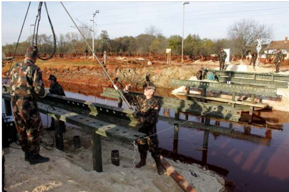
31 katona vett részt az építésben.