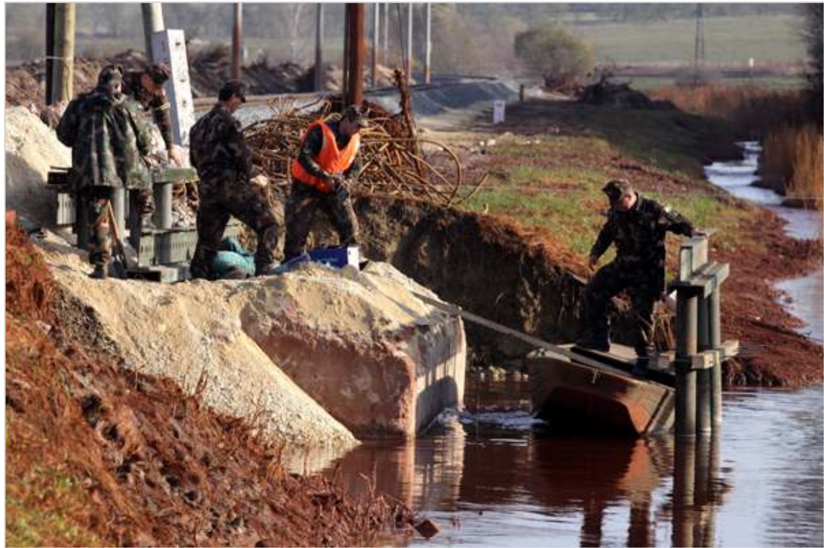
20 tonna teherbírású, 15 méter hosszú és 5,8 méter széles hidat építettek a Torna-patak fölé.

A szerkezet mindkét végén a szentesi katonák címerét ábrázoló faragott táblát tettek ki, és a híd elkészültének dátumát is rávésették. A szalagokkal lezárt, rendőrök által őrzött híd korlátjai felett ott lobog a műszaki ezred zászlaja.