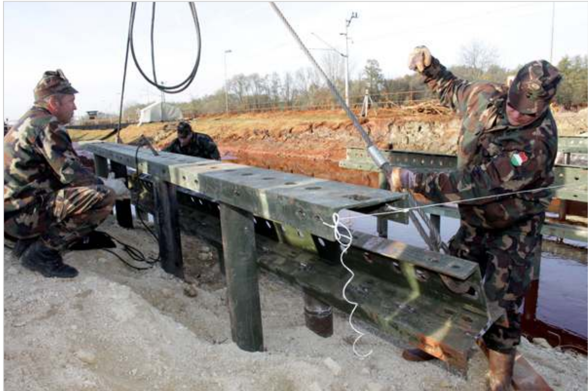
A katonák címere is látható az új műtárgyon.

A most elkészült híd átadása után a gyalogoshidat is elbontják a katonák.