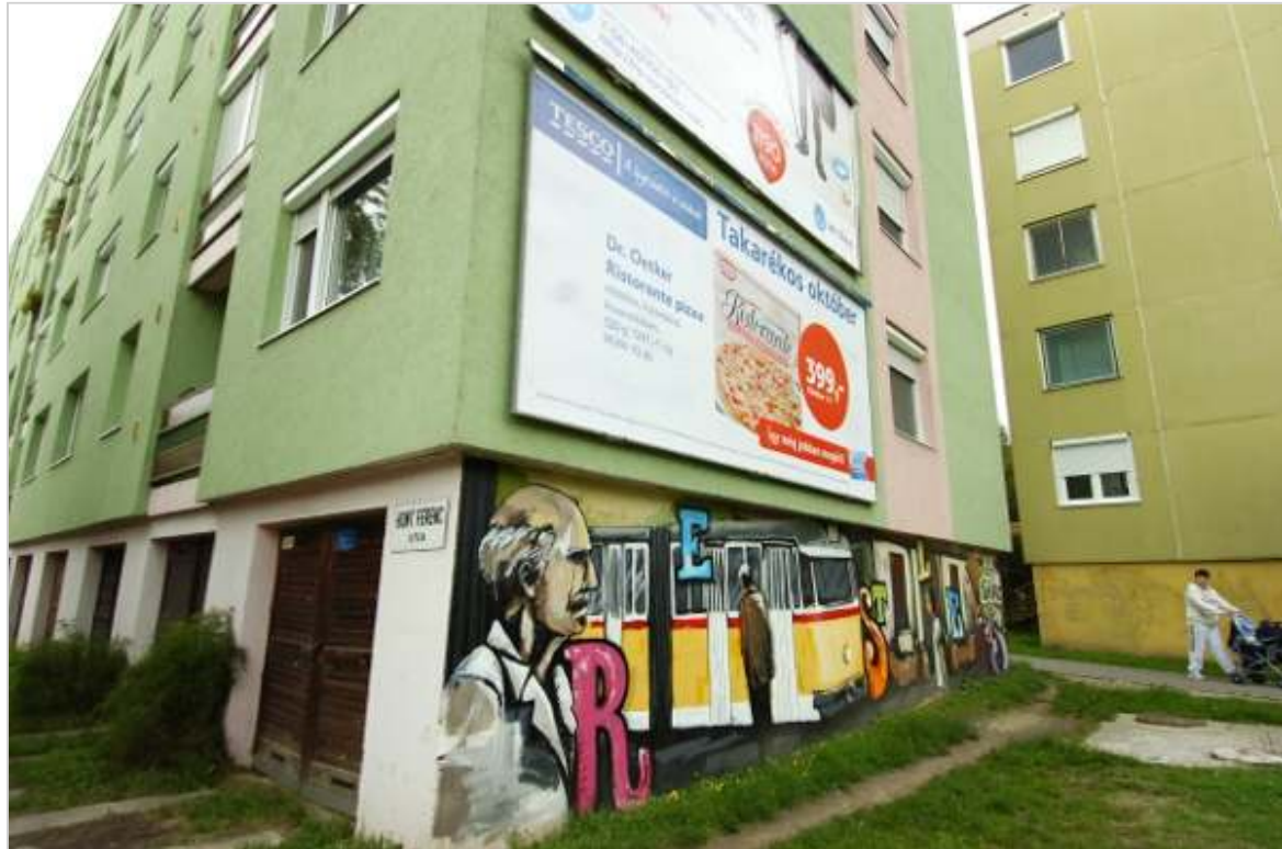
A lakóközösség úgy határozott, graffitivel megy a graffitisekkel szembe.