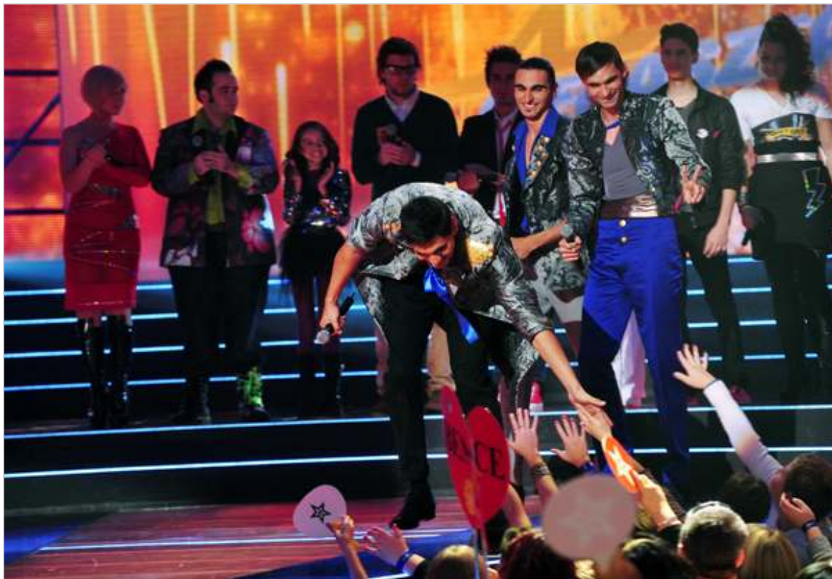
Jogosan járt a pacsi a Fivéreknek, végül mégsem kaptak elég szavazatot.

A zsűriből Eszenyi Enikő egy kicsit megint fanyalgott, ellentétben Friderikusz