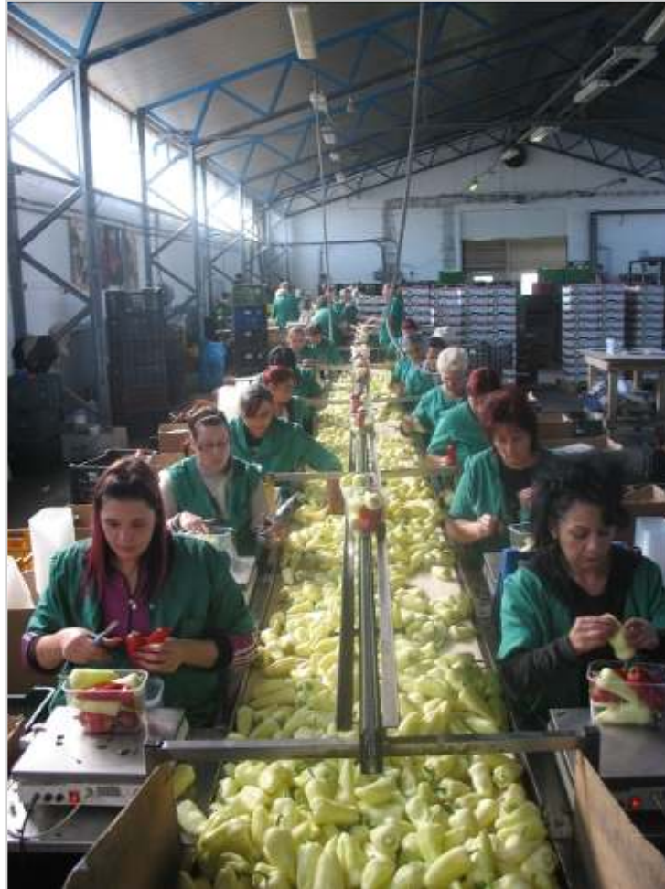
A Délkertész legfontosabb terméke a paprika, amelyet itthon főként nagy áruházláncokban értékesítenek, de exportálnak is belőle Németországba, Ausztriába, Szlovákiába és Csehországba.

Tehetik, hiszen a szövetkezet - amely egyébként megalakulásakor gyakorlatilag vagyon nélkül kezdte a munkát - pénzügyileg biztos lábakon áll. A Délkertész 2002 óta megháromszorozta, 2 milliárról közel 6 milliárd forintra növelte az árbevételét. Ma már egymilliárd forint tehermentes vagyonnal rendelkeznek.