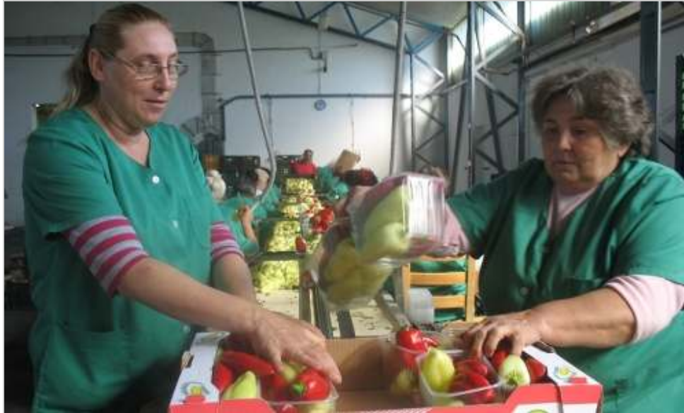
130 millió forintból új csomagolóházat építettek, és korszerű gépeket vásároltak.