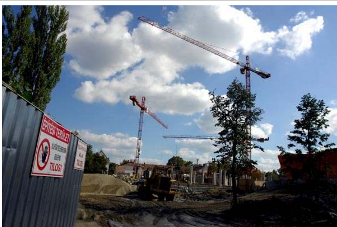
Az épülő makói fürdő. Mindenki szeretné majd befejezni.