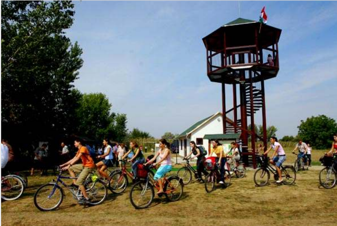
Még több turista Csongrádon.