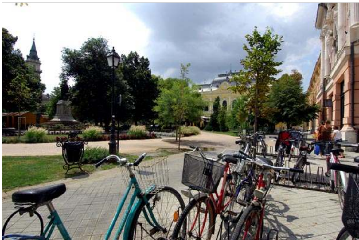
Még élhetőbb város lesz Hódmezővásárhely.