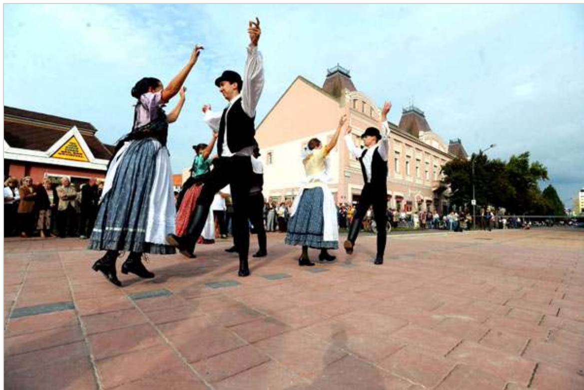
Új főutca, és munkahelyek sokasága. A valóság és az ígélet Szentesen.

25 kilométerre, északra Szentesen is négyen szeretnének polgármesterek lenni. A