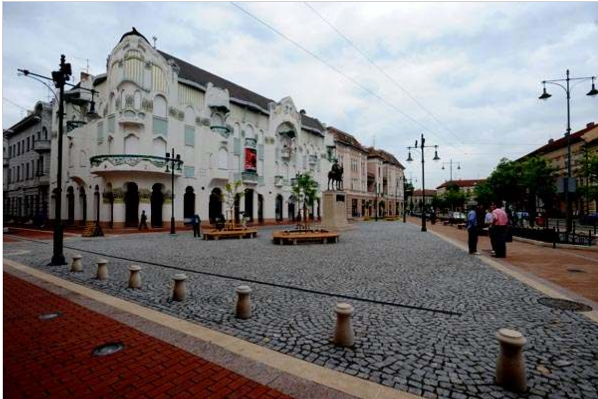
Valóban látványos felújítás. Csak kis töredéke az elmúlt évek fejlődésének Szegeden.