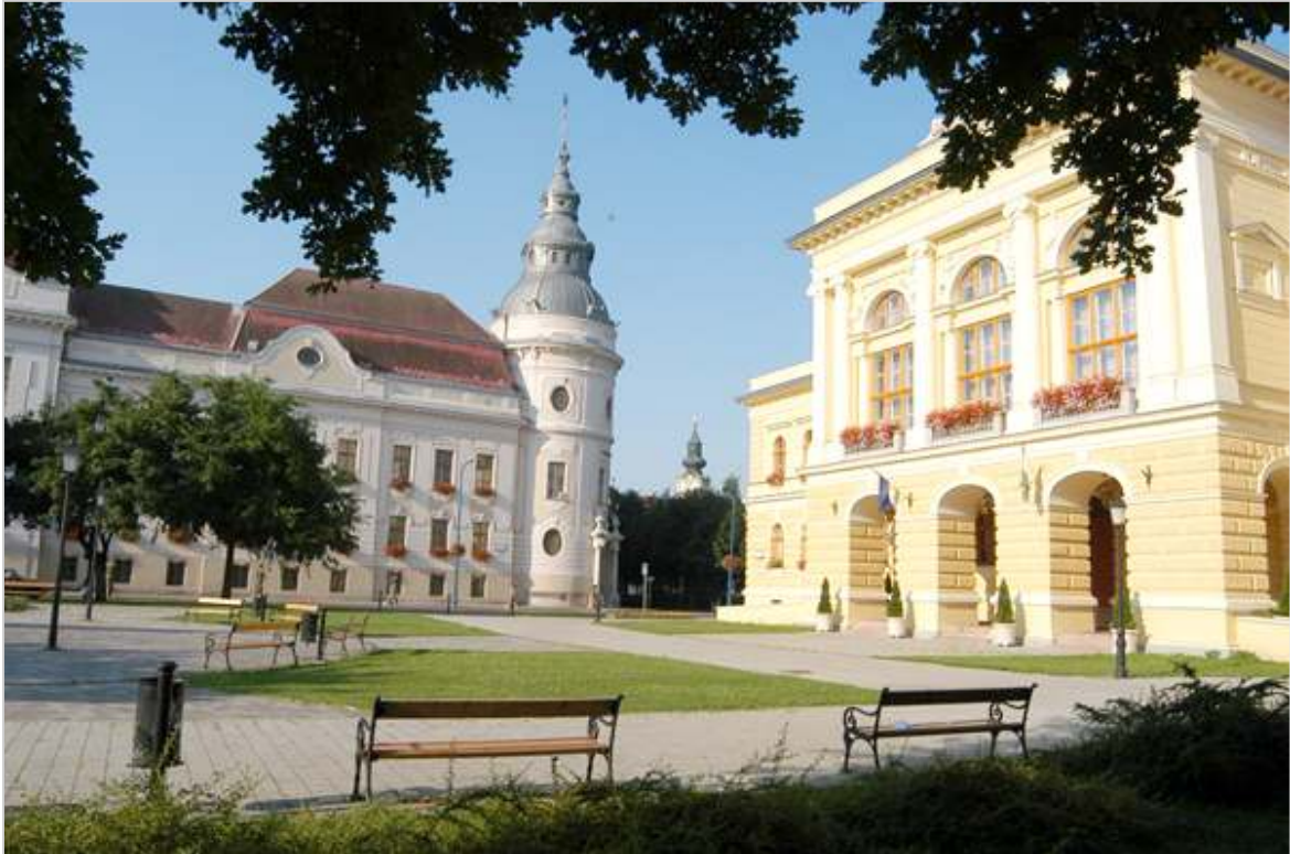
Szabadság, Szentes, Szeretem.

Az önkifejezés lehetősége, mások értékeinek felismerése, és a tőlünk távol eső viselkedésmódok, szokások elfogadása egy magasabb szintű társadalmi élet velejárói. Mégis felmerül mindenkiben a kérdés, hogy mit érzünk lakosként a városunkról, miben különbözik az élet más településekhez képest?