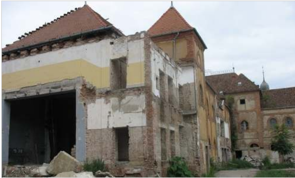
Gazos sitthalom a hotel udvarán.