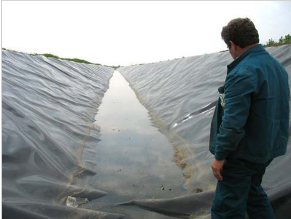
Ember és vad számára egyaránt veszélyes lehet a befóliázott öntözőcsatorna.