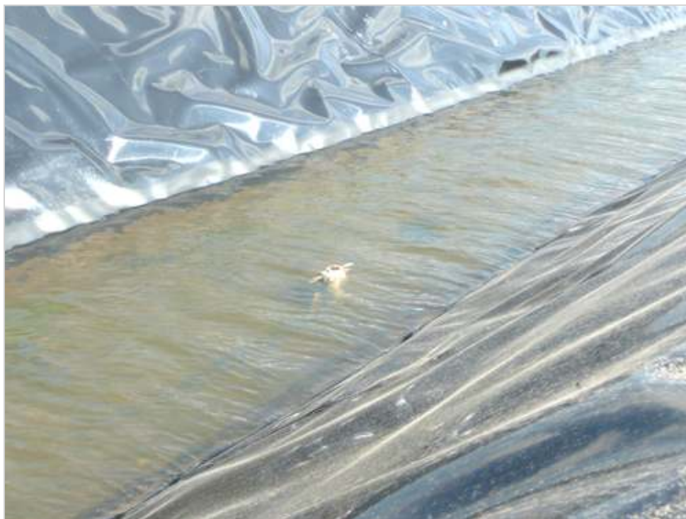
Több mezei nyúl is belepusztult már a befóliázott csatornába.

Felhívtuk a területileg illetékes Körös-Maros Nemzeti Park igazgatóságát, ahol elismerték, egyre nagyobb veszélyt jelent a hazai vadállományra az árok befóliázása, de ez a fajta szigetelés teljesen jogszerű. Mivel védett állat is van a Szentesnél elpusztult vadak között, vadvédelmi bírság kiszabása várható, de hosszabb távon abban látják a megoldást, ha az ilyen árokbélelések előtt vadrámpák építésére köteleznék a beruházó szervezeteket. Kerestük az Alsó-Tisza Vidéki Környezetvédelmi, Természetvédelmi és Vízügyi Felügyelőséget, hátha meg tudják mondani, milyen következményei lehetnek ennek az esetnek, illetve mivel lehetne elejét venni az effajta vadpusztulásnak. A hivatal időt kért a válaszadásra.