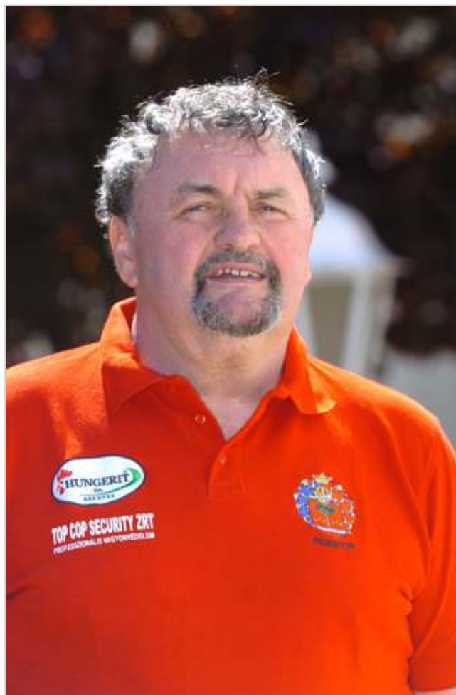
Szentesi vereség Szolnokon.