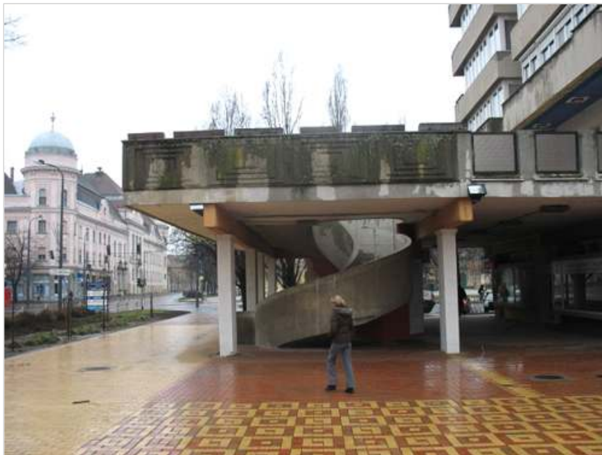
Szentesi belváros, Fehér Ház és környezete - ma.

Az anyag kidolgozása közben megkérdezték a terület lakóit, valamint a középiskolásokat, ők mit tartanának a legfontosabb újításnak. Az egyik legtámogatottabb terv az 1894-ben épült Kurca-híd bővítése volt, amely egy másik sikeres pályázat eredményeként már tavasszal megkezdődik, és 2011-ben fejeződik be. A fiatalok több zöldfelületet, illetve éjszakai szórakozóhelyet szeretnének a városközpontba.