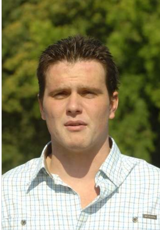
... és Éles Vilmos: most bizonyíthatnak.

- Az őszi „El Clásico” nem jó emlék, mentségünkre szolgáljon, az volt az első tétmeccsünk, nem voltunk még összeállva - magyarázta a „nehéztüzér”. - A mai lényegesen küzdelmesebb mérkőzésnek ígérkezik, sokkal nehezebb dolga lesz a Szegednek. Megalkuvást nem ismerő játékkal akarunk bizonyítani új edzőnknek, dr. Tóth Gyulának, és természetesen a fanatikus közön