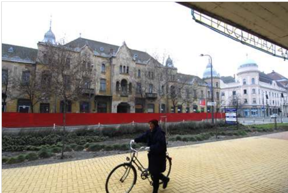
Csak pénzügyi akadálya lehet a szálló felújításának.