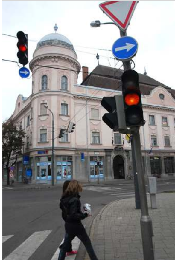
2010 őszeig megépül a Kossuth téri körforgalom.

- Miután elkészülnek a Petőfi utcán az útburkolat helyreállításával, visszakapcsoljuk a rendőrlámpát - mondta lapunknak Cseuz Csaba. A polgármesteri hivatal munkatársától megtudtuk, 2010 őszeig megépül a körforgalom a Kossuth térnél, ami végleges megoldást hoz, addig pedig estékre és hétvégékre sárgán villogóra állítják a jelzőlámpát.