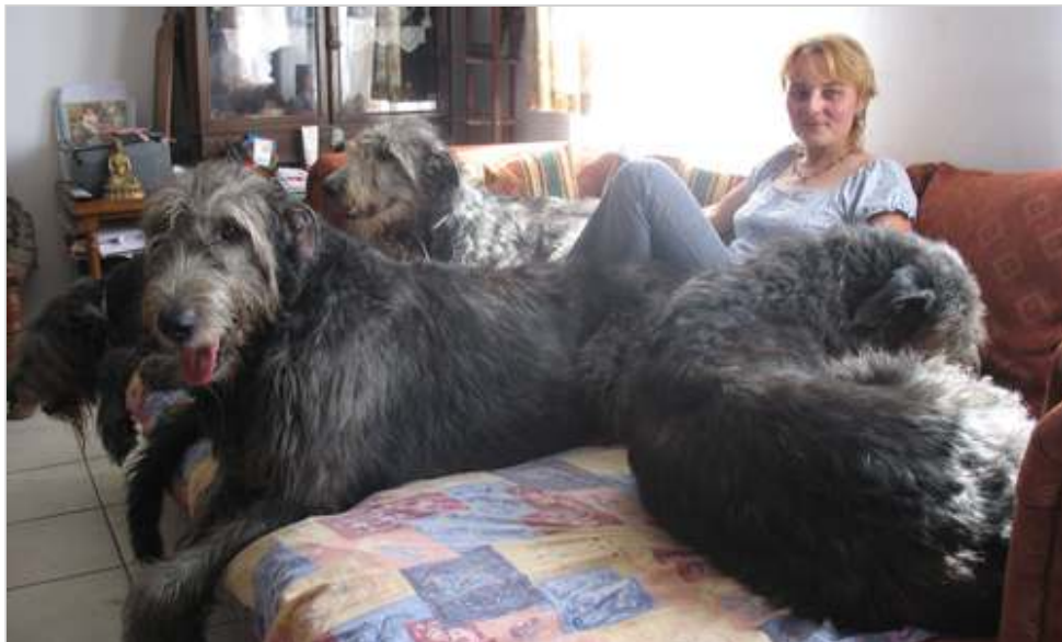
Édes élet. Csilla szerint megszállottság nélkül nem tudtak volna ilyen eredményes ír farkas kennelt létrehozni.

- Szerelem volt első látásra - meséli Csilla megismerkedésükről. Férjével házörzöt kerestek kiséri kertés házukhoz, amikor 1992-ben felfedezték maguknak az ír farkast. Az agarakhoz tartozó kutyafajta annyira szívükhöz nőtt, hogy néhány éven belül már ez a borjúnyi eb határozta meg mindennapjaikat. Hogy külsőleg és egészségileg is megfelelő tenyészetet hozzanak létre, figyelték a külföldi szaporulatokat, és végül