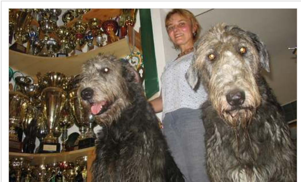
Dicsőségfal. Szobányi érmet nyertek már össze gazdáiknak a szentesi kennel tagjai.

Juhászék elhivatottságát jelzi, hogy fajtamentést is végeznek: náluk öregszenek meg azok a példányok, akik nem kellettek senkinek.