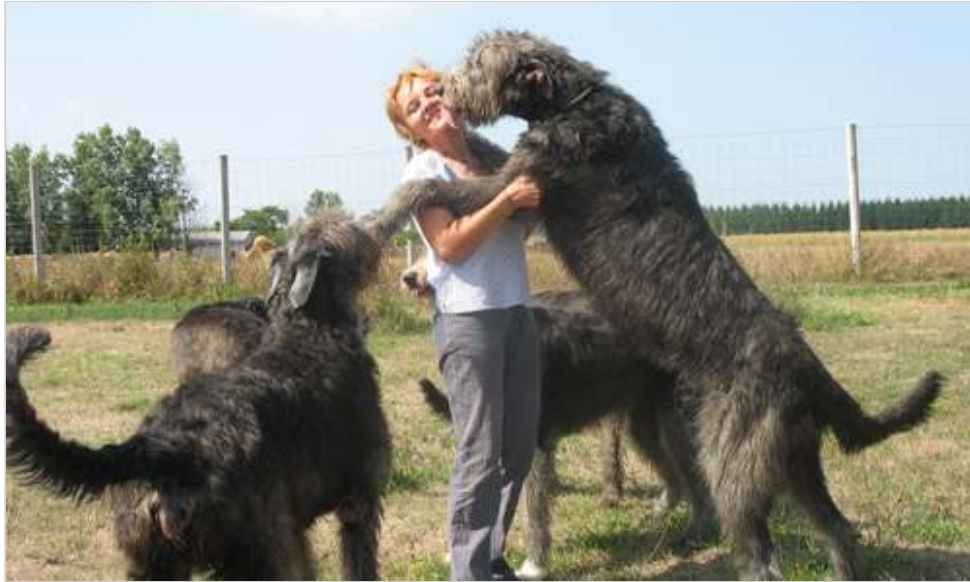
A Bíró Dániel felvételén látható óriáskutyák legutóbb a dublini Euro Dog Show-n kápráztattak el mindenkit