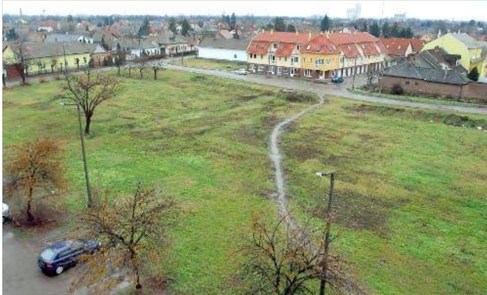
Nem tudni, mikor kezdődik az építkezés az 5000 négyzetméteres szentesi telken.