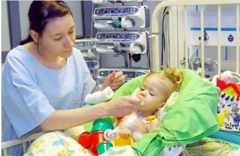
Larának az egész országból keresnek szívet.

- A műszíves kezelés szövődményei átlagosan fél év után jelentkeznek, ezek vérzést idéznek elő, és emellett vérrög keletkezik - tudtuk meg Lara kezelőorvosától, Ablonczy Lászlótól. - Az elmúlt időszakban több felajánlás is érkezett, de eddig sajnos egyik szív sem volt megfelelő a kislánynak.