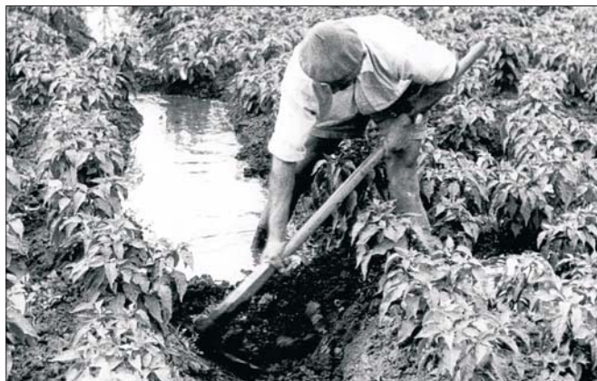
Munkában a motikával.

1914 nemcsak az első világháború nézőpontjából fontos dátum, hanem a magyarországi bolgárok vonatkozásában is kitüntetett helyet foglal el, ugyanis ebben az esztendőben alakították meg a Bulgáriából bevándorolt kertészek saját kulturális egyesületüket, amely alapvető szerepet játszott identitásuk megőrzésében. Erre az alkalomra a hazai bolgár kisebbség intézményei emlékévet hirdettek, amelynek keretei között időszaki kiállítások nyíltak, emlékművet avattak valamint kulturális rendezvényeket és konferenciákat szerveztek. Szvetla Kjoszevának, a Bolgár Nyelvoctató Nemzetiségi Iskola igazgatójának a meghívására vehettem részt november 7-én, Budapesten a „Gazdasági migráció, intézmények és szervezeti élet a diaszpórában élő bolgárok körében” című tudományos tanácskozáson, amelyen magyar és bolgár kutatók tartottak előadásokat e jeles évforduló alkalmából. A konferencián elhangzott beszámolóban a Szentes környéki bolgár nemzetiségű kertészek megtelepedésének és beilleszkedésének körülményeit vázoltam fel, ami számos újdonságot hordozott a témával behatóan foglalkozó hazai és