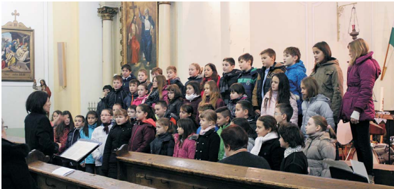
A Deák-Damjanich és a Kiss Bálint általános iskolák közös énekkara