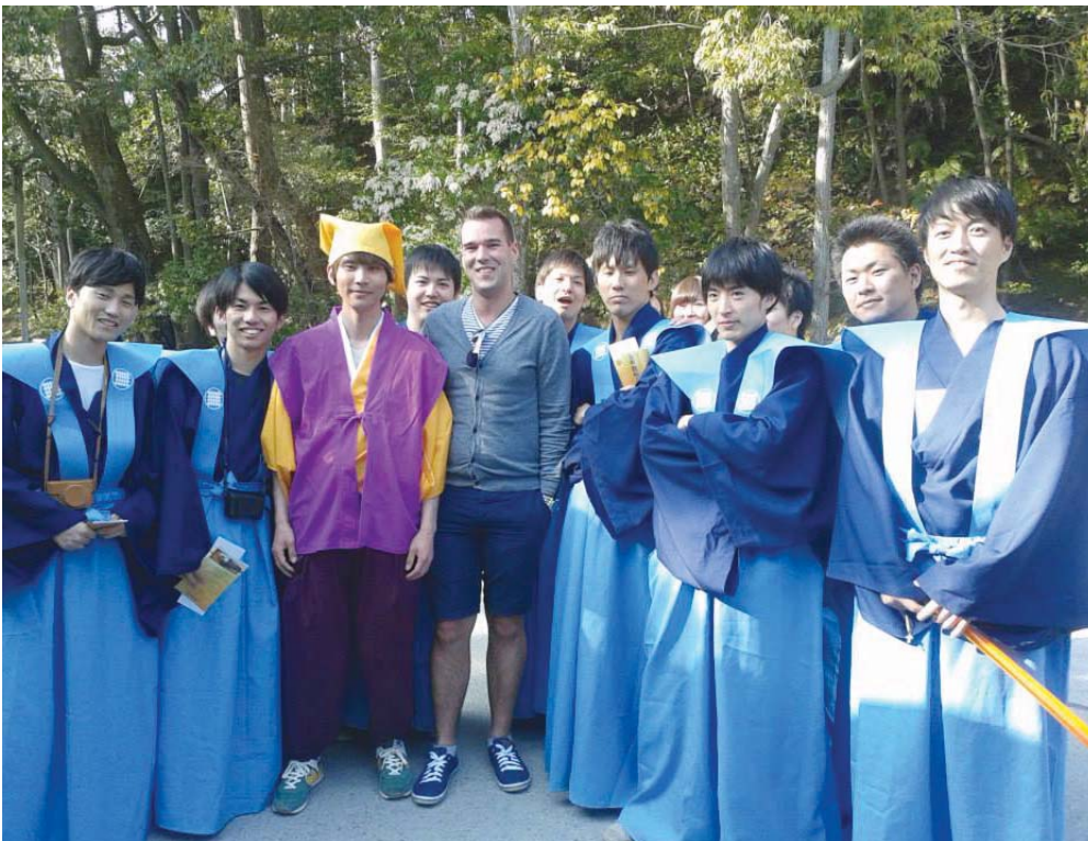
Kyoto-ban japán diákokkal is találkozott a világotutató fiatal.

Hatvanegy országban járt, számtalan élménnyel gazdagodott, közben felnőtt lett az egykor középiskolás fiúból. Kétszáz méter magasról ugrott a mélybe Új-Zélandon, Japánban szentélylátogató körutat tett, kínai kikötőben tett látogatást. Japán után Kína egész más élményt nyújtott. A nagy szegénység és gazdagság közötti kontraszt azonnal megtette a hatását a fiúra. Szingapúrt a világ egyik legtisztább városaként ismerte meg, ahol nem