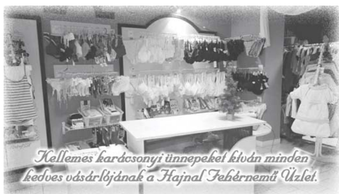
Kellemes karácsonyi ünnepeket kíván minden kedves vásárlójának a Hajnal Fehérnemű Üzlet.

feladata, én pedig a mentorálás szerepét vállaltam magamra. Rövid idő elteltével is van már látszatja az aktivitásuknak, a múzeumpedagógus munkáját nagy-