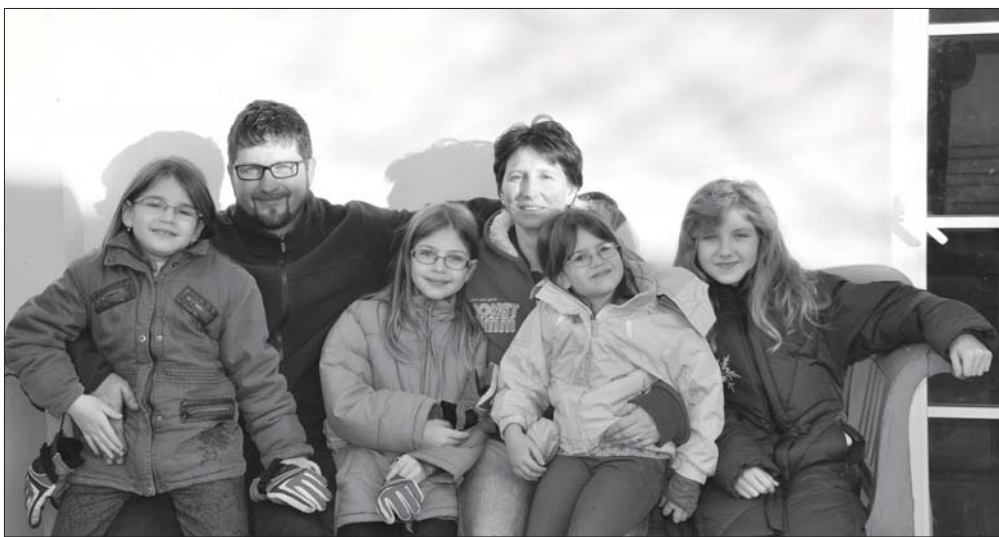
Mindent együtt csinálnak, a szeretet teszi boldoggá az év családját.

– Beültünk a férjemmel az autóba és utcáról utcára járva kerestük az eladó házakat. Amikor ezt megláttuk,