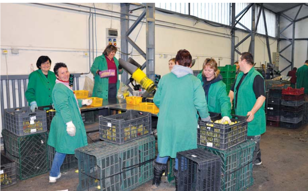
A DélKerTész csomagolóüzemében decemberben is folyik a munka.

A szövetkezetnél a költségek emelkedtek az egész évben tapasztalható magas üzemanyagárak, a szállítást terhelő e-ütdíj és a dráguló