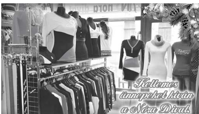
Kellemes ünnepeket kíván a Nóra Divat

Békés, boldog karácsonyi ünnepeket és eredményekben gazdag új évet kíván minden kedves ügyfelének a D-Trio Kft.