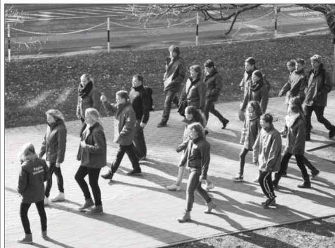
Februárban holland vízlabdacapat edzőtáborozott Szentesen.

Szentes Város Önkormányzata és a Szentesi Művelődési Központ közös szervezésében a Megyeháza Konferencia és Kulturális Központ dísztermében (Szentes, Kossuth tér 1.)