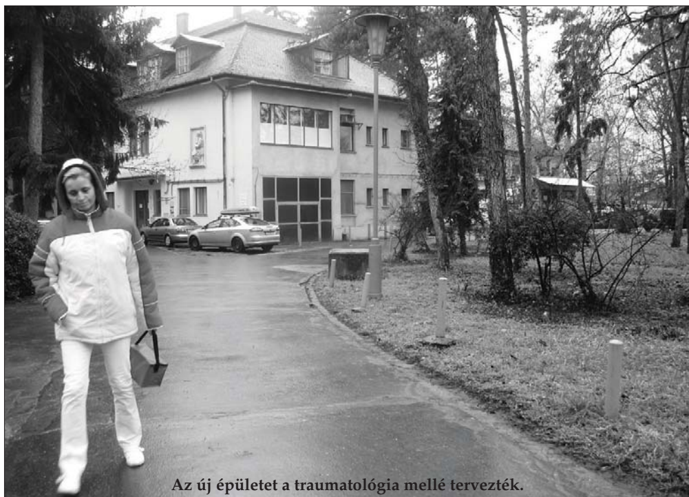
Az új épületet a traumatológia mellé tervezték.

Úgy tudjuk, a teljes dokumentáció az irattárba került, a beruházáshoz érvényes építési engedélye van a kórháznak, vagyis csak le kellene porolni a pályázati anyagot, mielőtt benyújtják. A probléma ott van, hogy továbbra sem ismert, kapna-e elég támogatást a szentesi intézmény a hárommilliárdos fejlesztéshez. Az állami fenntartó GYEMSZI januári közleményében azt írta, a mintegy 35 milliárdos program keretében várhatóan 35-40 pályázat kap támogatást, egy pályázat maximum 3 milliárd forint-hoz juthat. A pályázatokat