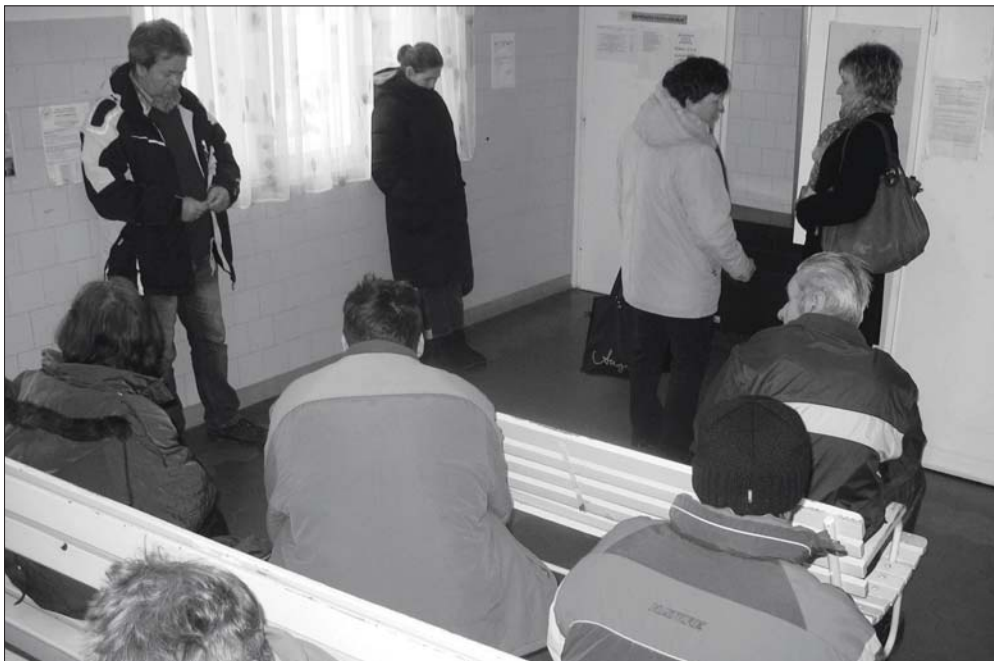
A Vörösmarty utcai rendelőhöz évtizedek óta nem nyúlt a tulajdonos önkormányzat.

A költségvetési vita előtt a polgármester ügy fogalmazott, számos jogszabályváltozás érintette az önkormányzatot és intézményeit - ebből az átszervezésből 392 millió mínusszal jött ki a város. A 2012-es 77 millió pénzmaradvány és az intézményi takarékosági intézkedések tették lehetővé, hogy egyensúlyi büdzsétervezet került a képviselők elé. Kérdésekre válaszként elhangzott: a szűrőprogram folytatására és a Kiss Zsigmond utca átalakítására egyelőre nem látni forrást, a sportcsarnokban a parketta felújítására viszont lesz pénz. Másfélmillió forintot különítettek el a Természetes Napokra, amelyen Szentes környezettudatosságát mutatja majd be 4 másik város küldötteinek. Újabb fejlesztések indításához jelenleg nincs fedezet. Példaként említette a polgármester, hogy 40 millió önrész kellene egy új, műfüves labdarúgópálya építéséhez, a többit a szakági