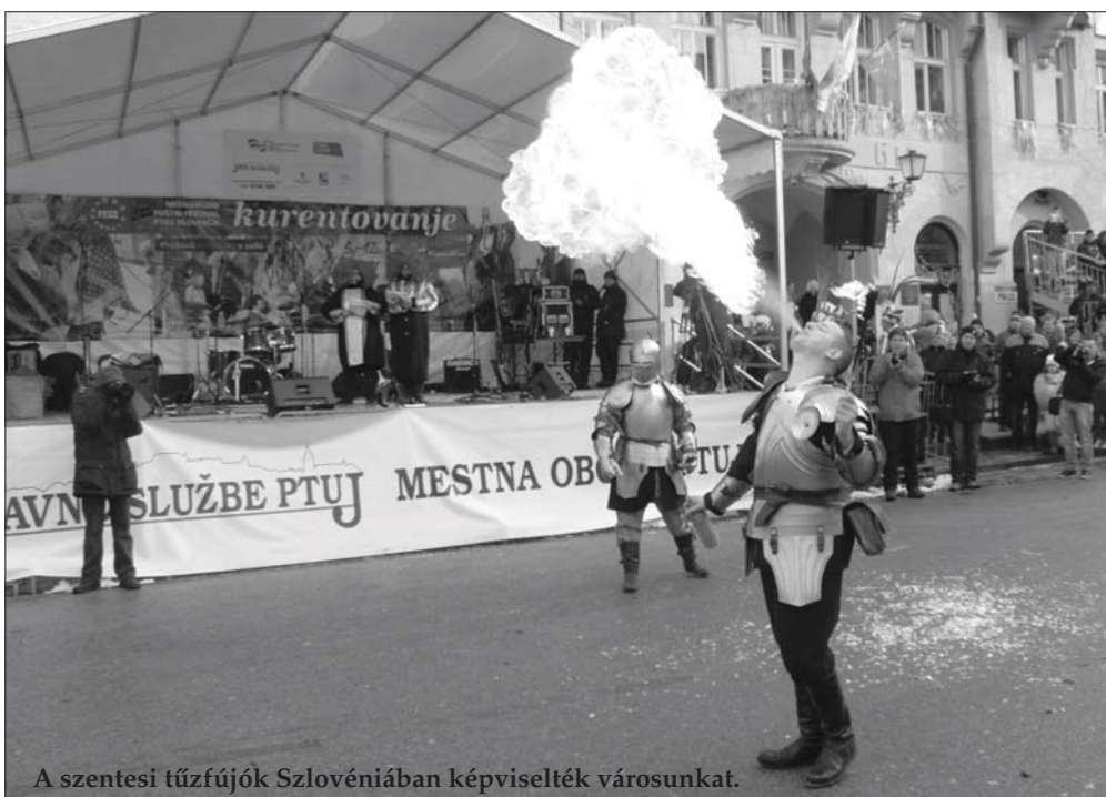
A szentesi tűzfűjók Szlovéniában képviselték városunkat.