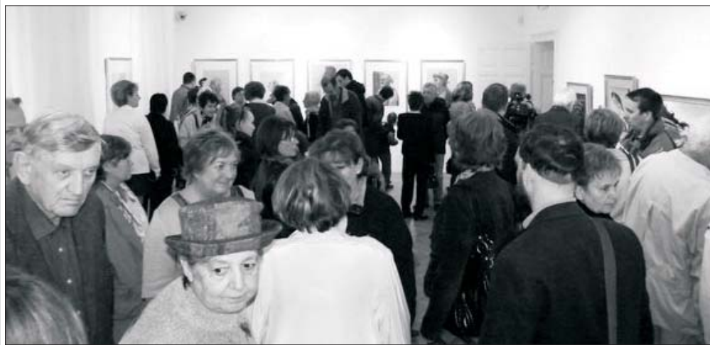
2011-ben több ezer látogatót vonzott a Csontváry-kiállítás.