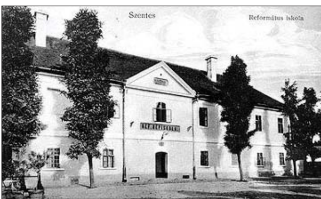
Az új, emeletes iskola a főtéren