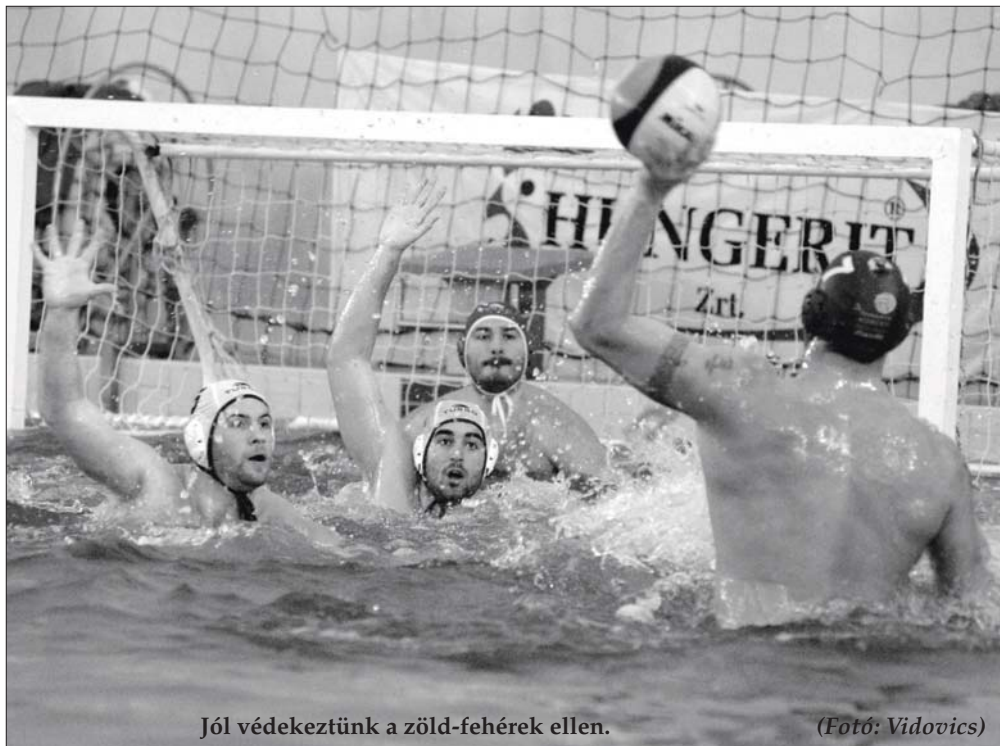
Jól védekeztünk a zöld-fehérek ellen.