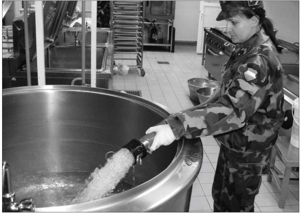
A központi konyhán is a katonák által szállított, arzénmentesített vízzel főznek.