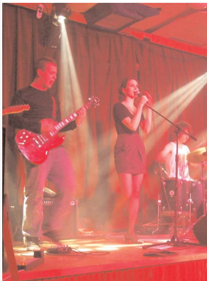
Az EbiFisH zenekar már saját számokat is ír.

Valótlant állítanék, ha azt mondanám, hogy időben eljutott hozzám a CD. Annak címe ugyanis a 2011 (év) számmal válik teljessé. A késés miértje feszegetésének kb. annyi értelme van, mint az üttesten frissen kivasalt földigilisztának.