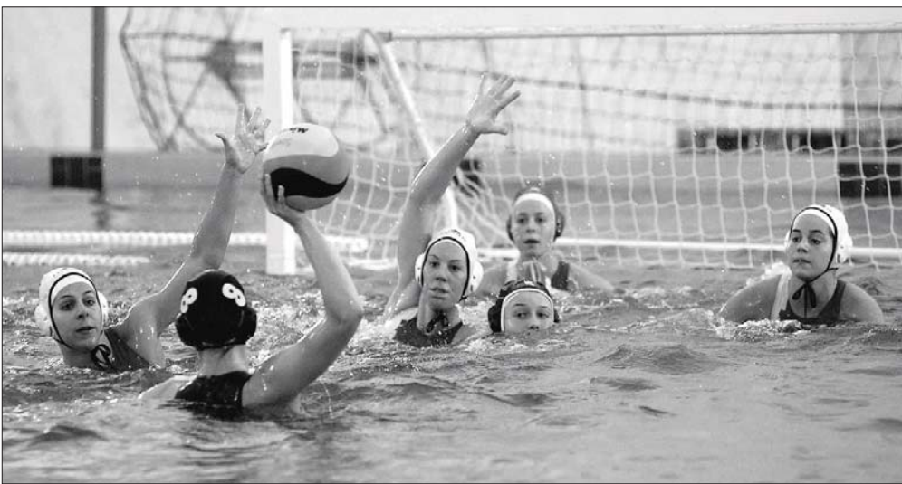
Visszavágó is lesz egyben a LEN-kupa elődöntő a szentesieknek.