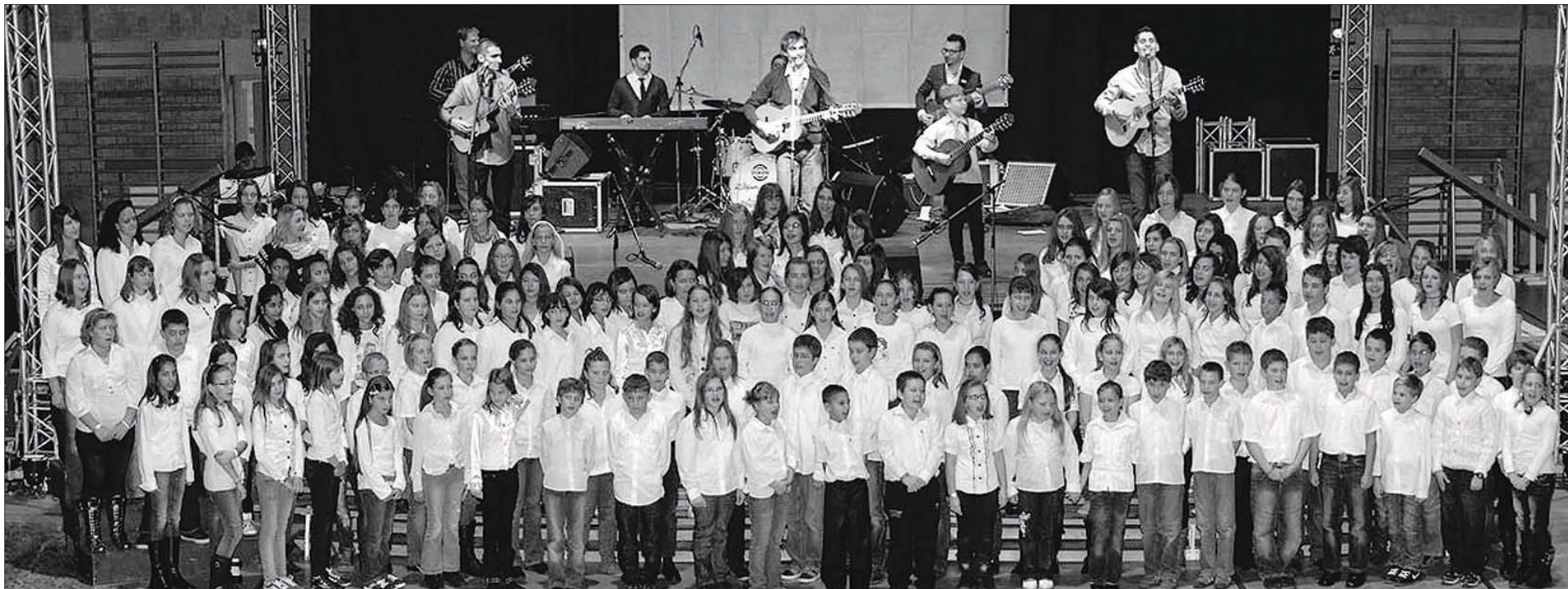
Az alapítvány koncertjének egyik meghatározó mősorszáma: iskolások 150 fős kórusa beteg gyerekekért énekelt.