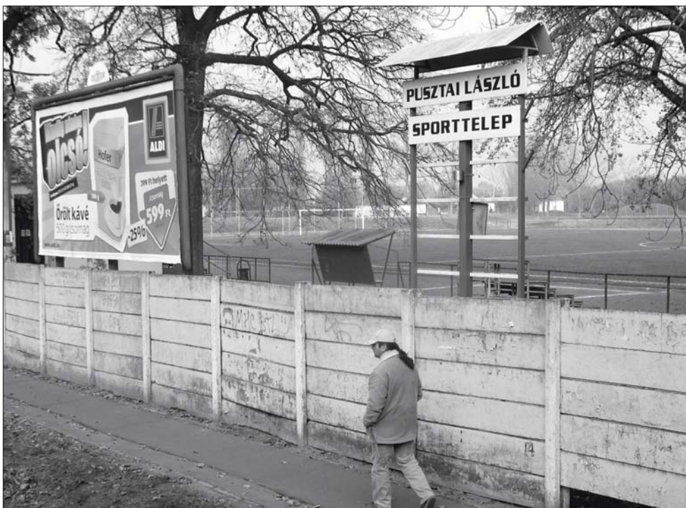
A kerítés felújításával kezdenék jövőre a sporttelep fejlesztését.