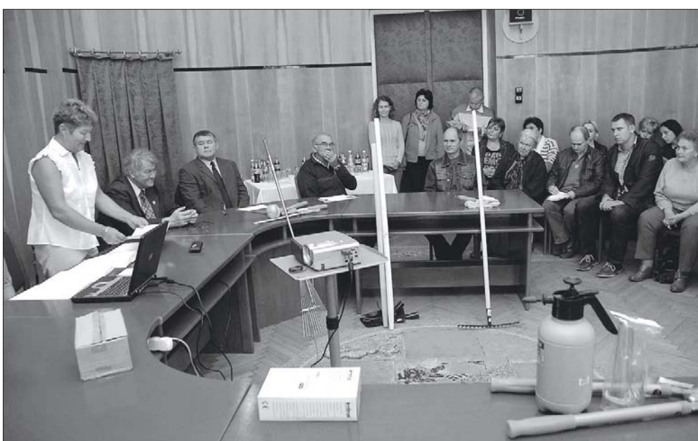
Évről évre többen neveznek a környezetszépítő versenyre.