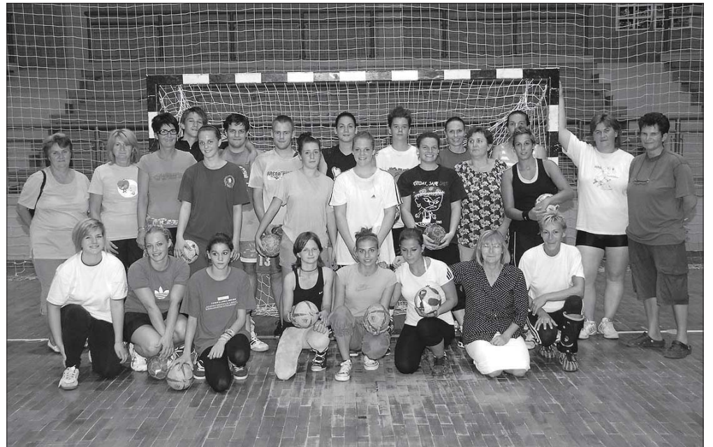
A helybeli és mindszenti hölgyekből álló csapat már túl van az első sikerén.