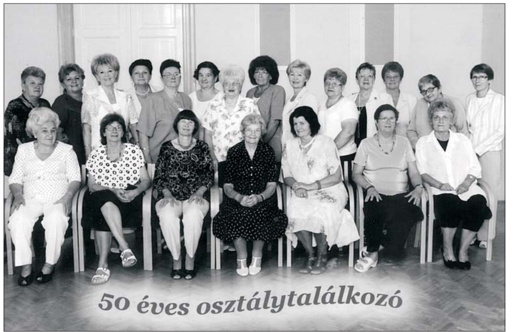
50 éves osztálytalálkozó

Pert indított a Négy Mancs Alapítvány osztrák, német és magyar szervezete ellen a Hungerit Zrt. Jó hírnevének megsértése, 2,5 milliárdos kára miatt fordult bírósághoz a szentesi cég, amit az állatvédők honlapja régóta állatkínzással vádol. A baromfifeldolgozó a Fővárosi Bíróságon nyújtotta be keresetét, amely a jó hírnevéhez fűződő jogok sérelméről, kártérítési igényről szól, és arra kéri a bíróságot, hogy tiltsa el az állatvédő szervezetet a jogsértéstől. A cél, hogy a vállalat lekerüljön a Négy Mancs Alapítvány honlapján szereplő „feketelistáról”.