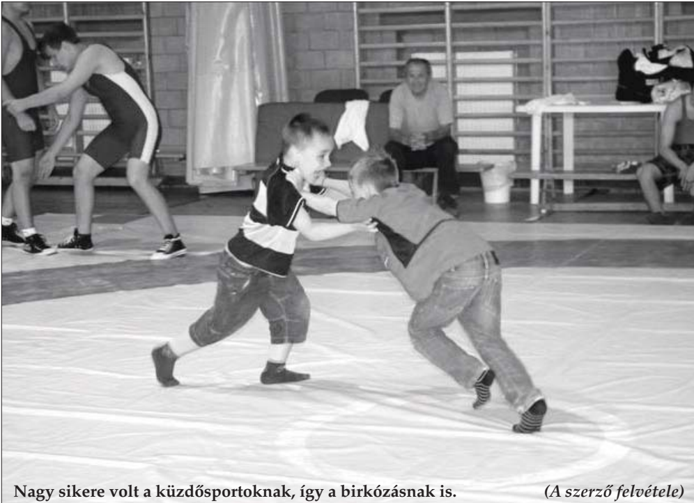
Nagy sikere volt a küzdősportoknak, így a birkózásnak is.