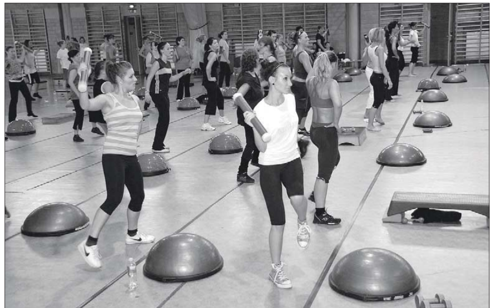
A tornákon erősítő segédeszközöket, BOSU-t és X-co-t is használtak.