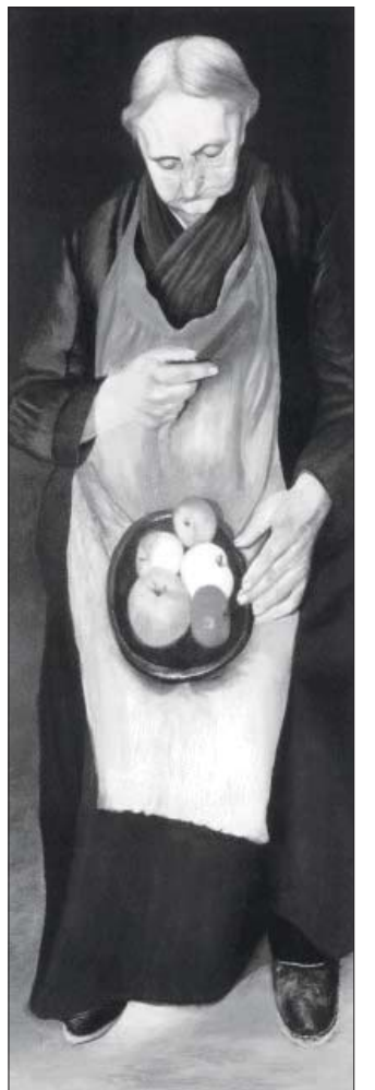
Csontváry Kosztká Tivadar: Almát hámozó öregasszony (1894)

A tárlat emelt árú belépővel tekinthető meg, ám a Szentesen megváltott jegyet beszámítják a drágább szegedi tikkelt árba, csak a különbözötet kell kifizetni, s fordítva: aki a megyeszékhelyen már megnézte a kiállít-