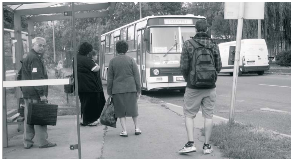
Reggeli „csúcs” - szerdán öt utas várt a kertvárosi ABC-nél a helyi járatra.