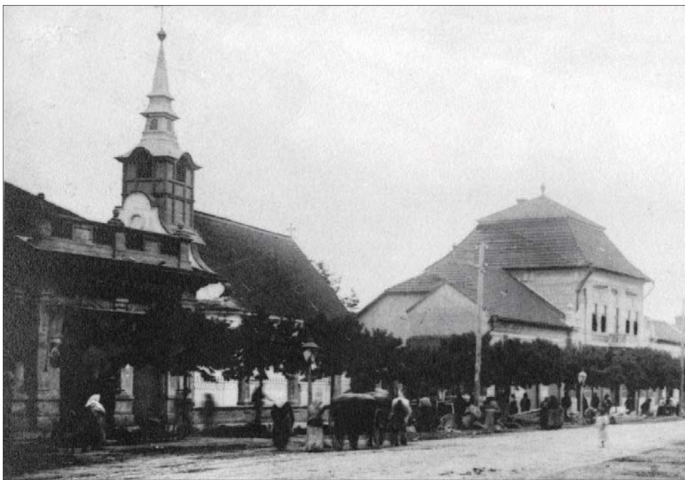
A görögkeleti templom a fatoronnyal