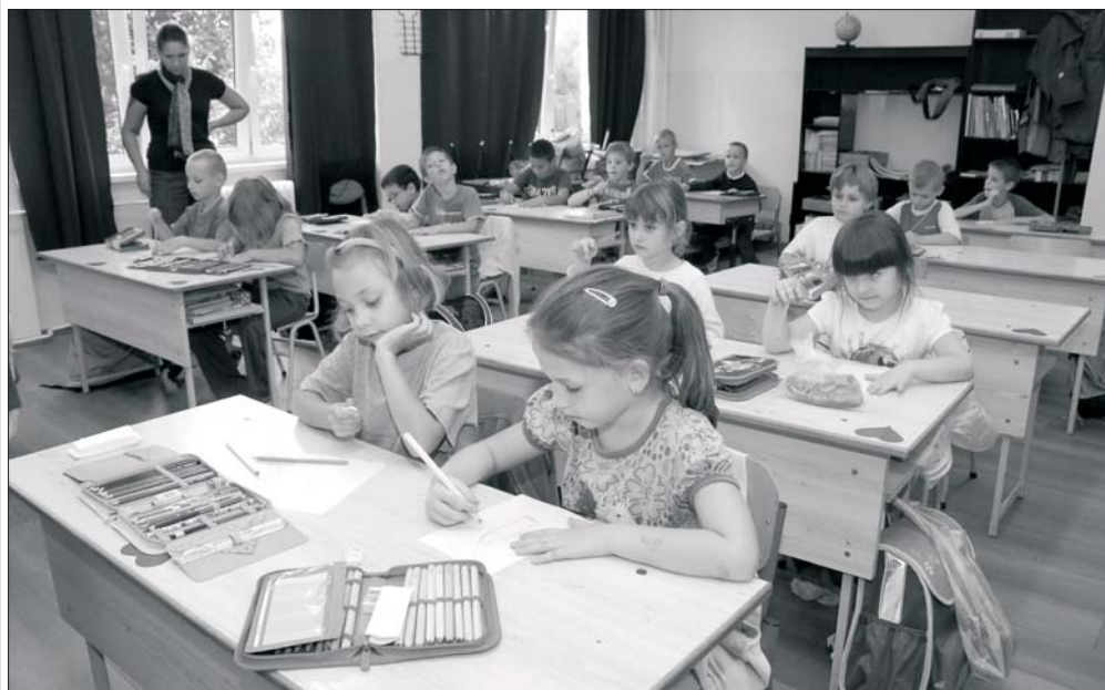
Az elsős gyerekek jól érzik magukat a Deák-iskolában.