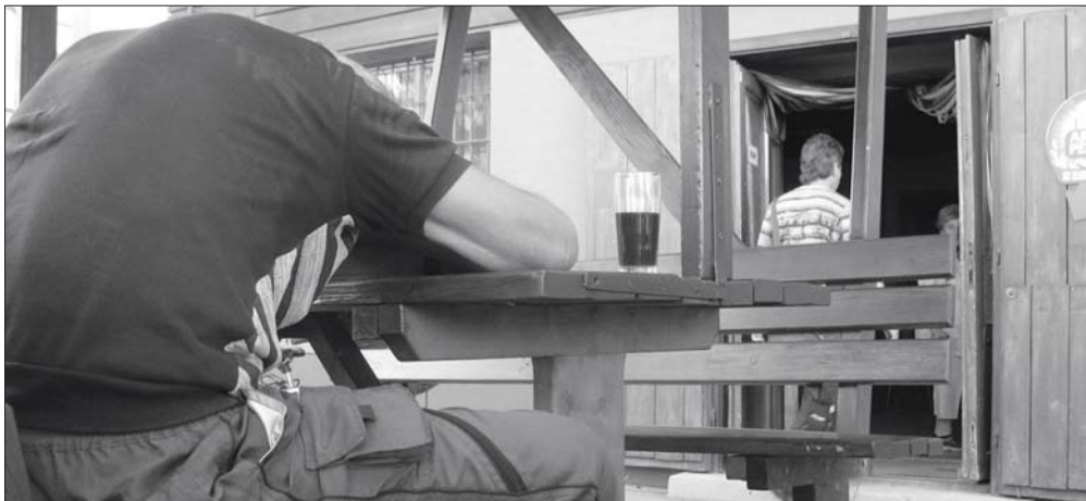
Nem csak a vendégek, a vendéglátók is bedőlhetnek a jövőben.

Tizenöt év működés után augusztusban bezárt a Nádás Csárda – ez az első jele lehet annak, hogy átrendeződés előtt áll a vendéglátás Szentesen. Megnyitása előtt, az 1990-es évek első felében csupán két étterem működött a városban, 1996 óta viszont megötszöröződött az ilyen vendéglátó egységek száma. Mindeközben a népesség 10 százalékkal, 3000 fővel csökkent a Kurca partján. Mindkét tendenciának meghatározó szerepe lehet abban, hogy mára a lehető legkiélezettebb verseny folyik a vendégek becsábításáért. Ezt támasztja alá, hogy az elmúlt években szinte mindegyik vendéglátó menüzetéssel próbálta növelni az a 'la carte étkeztetésben csökkenő bevételeit. Arra is van már példa, hogy csupán ebédidőben nyit ki egy étkezde, mert így minimalizálni tudja költségeit. Ugyancsak nem tett jót a szentesi éttermek és pizériák forgalmának, hogy a 1990-es évek vége óta a kistérségben is jelentősen, 10 százalékkal meghaladón nőtt a vendéglátó egységek száma, és az sem kedvezett, hogy a gyorsétkezdék is