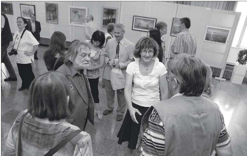
Pillanatkép a megnyitóról, előtérben szemben a két művész.