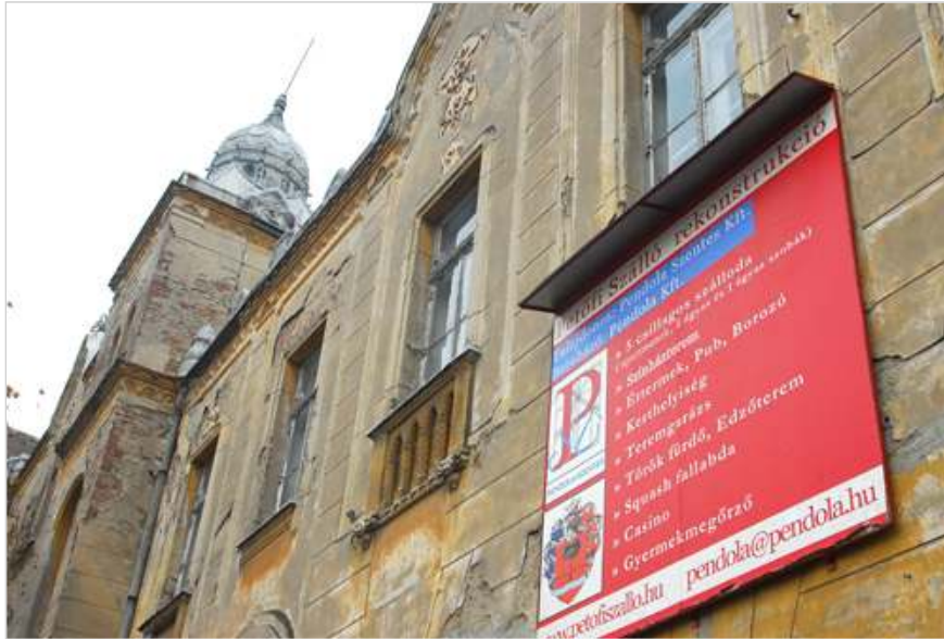
Az építetők visszavesznek a luxusból.