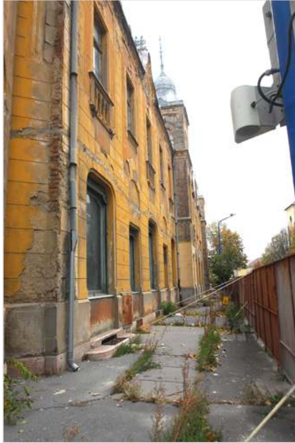
A mostani állapotában csillag alatti Petőfi Szállóból ha nem is öt, de négycsillagos hotel lehet 2011ben.

A város első embere arról is beszámolt, hogy első körben 4 csillagos minősítést kapna a Petőfi. Mint megtudtuk, azért nem nyílhatna meg 5 csillagosként a szálló, mert a fejlesztés első ütemében nem épülne meg a mélygarázs és a hotel új, 70 szobás tömbje, amit a Művészetek Háza melletti üres telekre álmodtak a tervezők. Utóbbiak engedélyezési kérelmét jövő év elején nyújtánák be, és ha megépülnek, a szálló is megkaphatja az ötödik csillagot.