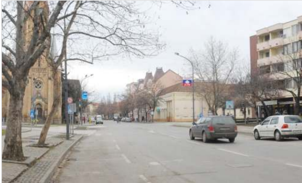
A stratégia része Szentes belvárosának megújítása - a Kossuth utcán kerékpárút is épülne.

Emellett újabb parkolóhelyeket létesítenének a Szent Anna utcai óvoda mellett, de a sort még folytathatnánk. A belvárosba tervezett beruházásokat még nem támasztották alá költségbecsléssel, de a fejlesztések megvalósítása milliárdos nagyságrendű. Az integrált városfejlesztési stratégiát márciusi ülésén tárgyalja majd Szentes képviselő-testülete.