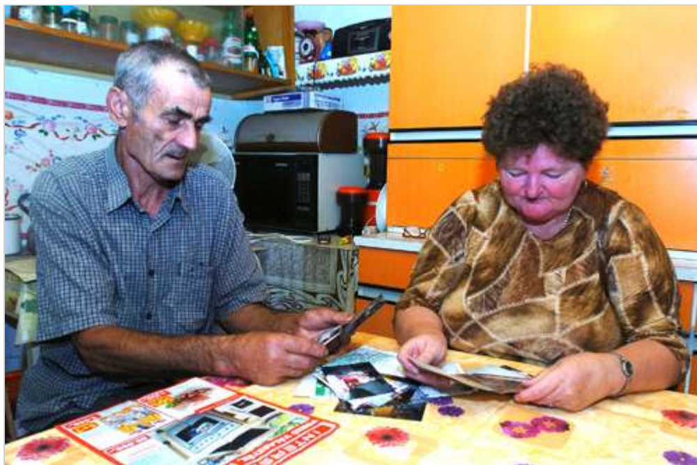
Juditról máig sem tud biztosat a szentesi Koncz család.

Mivel a rendőrség állítása szerint Judit eltűnésekor nem merült fel konkrét bűncselekményre utaló adat, közigazgatási eljárás keretében vizsgálták az ügyet, amit három hónap után megszüntettek. A jogszabályok szerint ugyanis a közigazgatási eljárás maximális időtartama 90 nap, és ha ez eredménytelen, tehát a határidő anélkül telik le, hogy nem találnak holttestet, nem derítik fel az eltűnt személy tartózkodási helyét, akkor a közigazgatási eljárást meg kell szüntetni. Egy névtelenséget kérő szakértő szerint, ha a rendőrök büntetőeljárást indítottak volna Judit ügyében, más módszereket, akár operatív, titkosszolgálati eszközöket is bevethettek volna, amire a közigazgatási eljárás keretében elvileg nincs lehetőség.